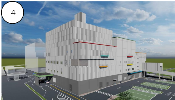
西知多クリーンセンター 外観カラー案